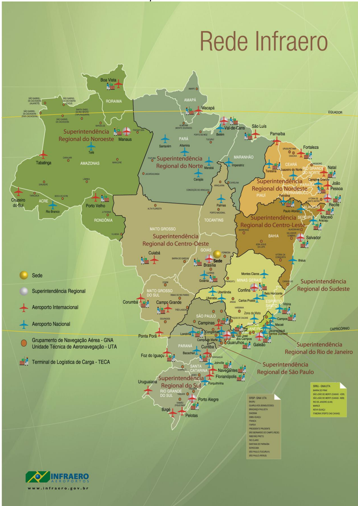
Mapa da Rede Infraero